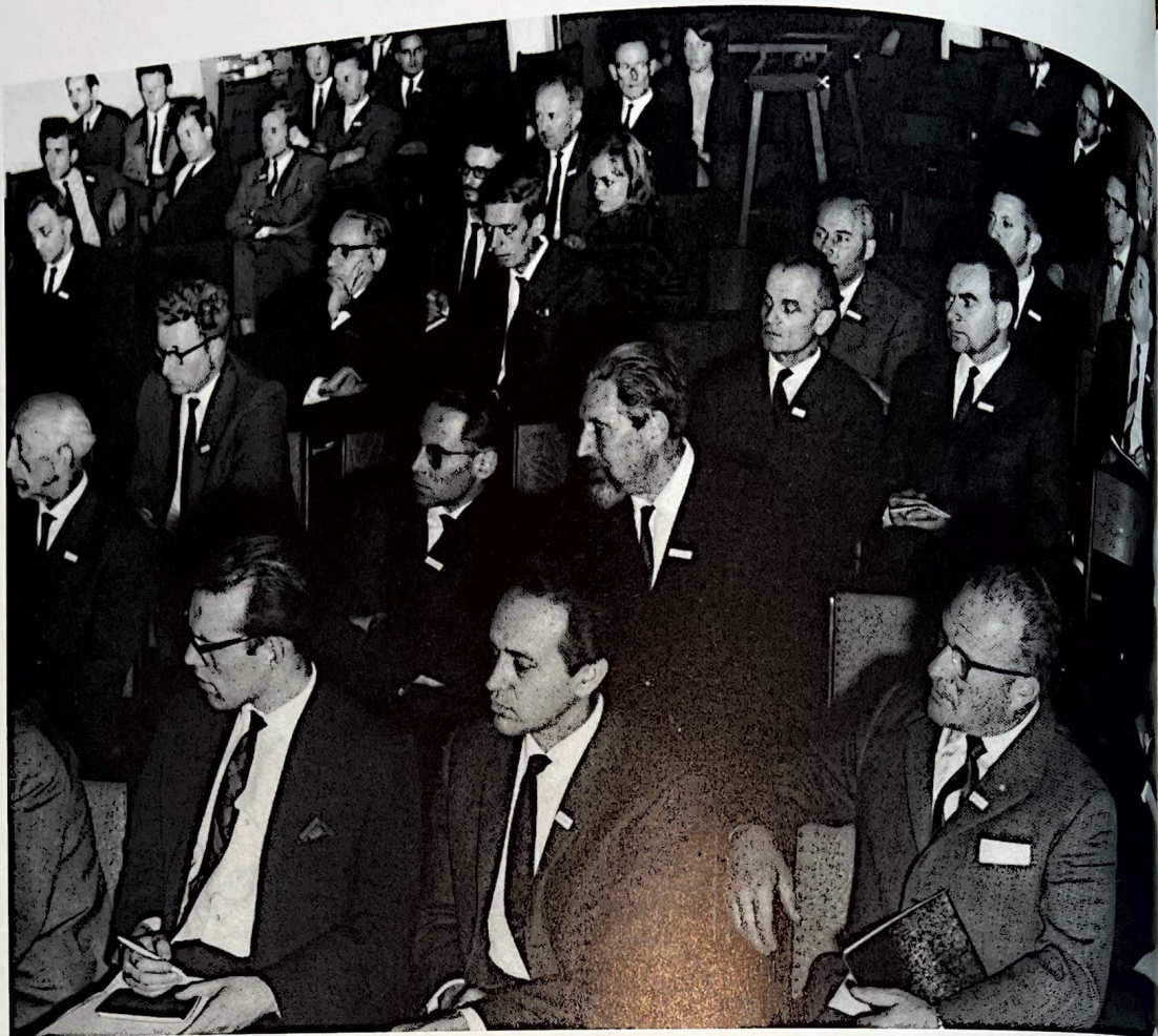
Abb. 5: Blick in den Vortragssaal der Trierer Tagung 1966

Maler und Graphiker war, ein graphisch gestaltetes Programmheft im Format DIN A5. Diese Art der Programmheftgestaltung wurde für einige Jahre, jeweils in einer anderen Farbe, beibehalten. Das Heft enthielt außerdem einen Rückblick auf die Arbeit der ersten 10 Jahre und den Entwurfsversuch eines Berufsbildes für Restaurator(inn)en kulturhistorischer Museen (Abb. 6).