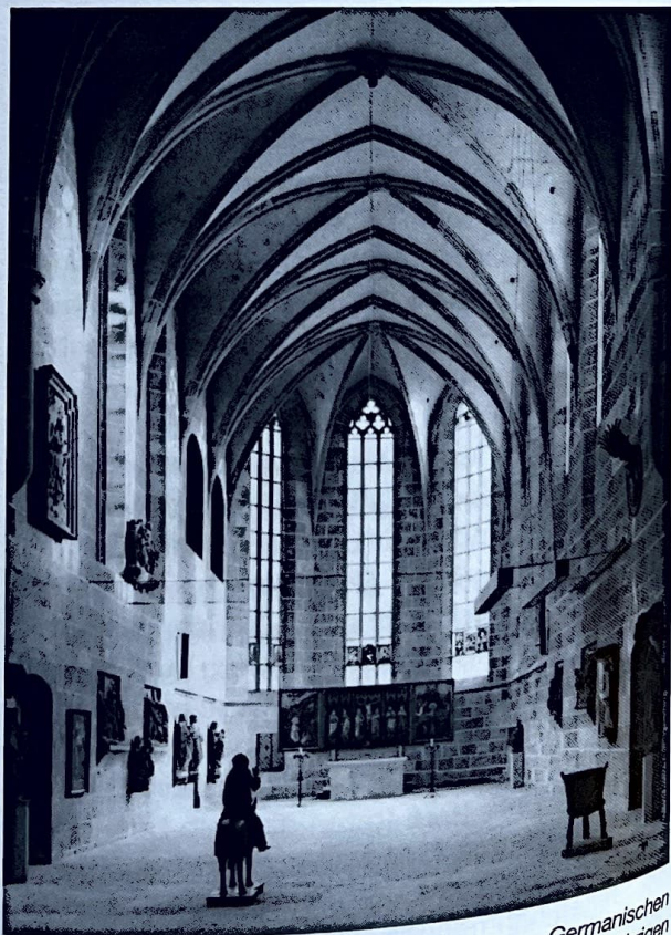
Abb. 11: Ehemalige Kartäuserkirche im Germanischen Nationalmuseum Nürnberg, wo der Festakt zum 25jährigen Bestehen der ATM stattfand.

Gleichzeitig mit dieser Veranstaltung beging die ATM ihr 25jähriges Bestehen, wozu ein Festakt in