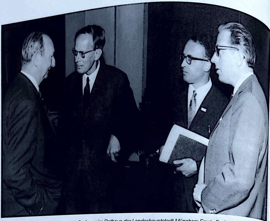
Abb. 9 und 10: Empfang der Tagungsteilnehmer im Rathaus der Landeshauptstadt München: Ernste Fachgespräche und ...

abgeschlossene Fachausbildung (eine solche gab es ja früher - außer für Gemälderestauratoren - noch nicht) nur aufgrund der Tätigkeitsmerkmale und ihrer Leistungen bis in die ersten Akademikergruppen (BAT III und II) aufsteigen konnten. Der Tarifvertrag war also ausgesprochen leistungs- und nicht ausbildungsbezogen - damals ein absolutes Novum!