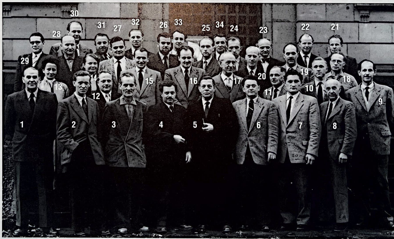
Abb. 2: Die Teilnehmer des Trierer Kurses 1956, der zur Gründung der ATM führte.