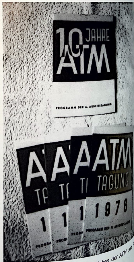
Abb. 6: Heft zum 10jährigen Bestehen der ATM und Programmhefte der folgenden Tagungen.