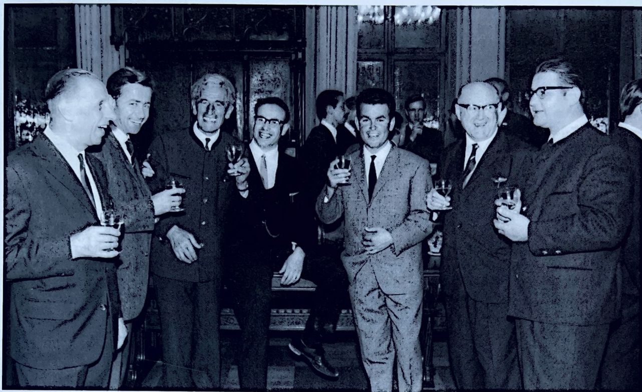
... Grund zum Feiern: Eigene Zeitschrift und Tarifvertrag sind unter Dach und Fach!

fanden zum ersten Mal eigene Arbeitssitzungen für Grabungstechniker statt. Neu war auch eine fachlich-technische Fragestunde unter dem Titel: „Fachleute fragen – Fachleute antworten“. Diese Fragestunden blieben bis 1985 ein fester, sich stets bewährender Bestandteil unserer Tagungen. Eine zweitägige Exkursion führte die Teilnehmer in die Schweiz, um die Werkstätten der Museen in Zürich, Bern und Riggisberg (Abegg-Stiftung) kennenzulernen. Die Teilnehmerzahl betrug 180.